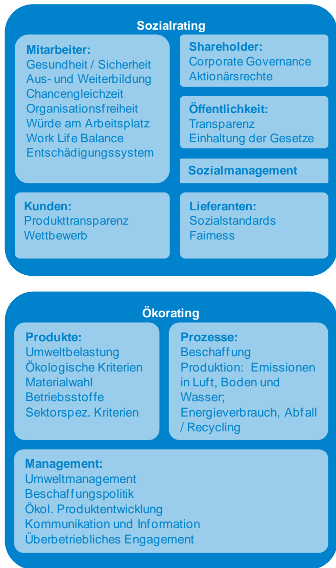
Abbildung 3: Kriterien für das Sozial- und Ökorating.

Schritt 2 Bewertung: Die Unternehmen im Analyseuniversum werden verschiedenen INRate-Sektoren zugeteilt. Die Sektoren werden nach oben beschriebenem Prinzip „Best in Service“ definiert. Für die Bewertung der Unternehmen sind die INRate-Analysten zuständig. Als erstes prüfen die Analysten die ihnen zugeteilten Unternehmen auf ethische Aspekte. Unternehmen, die diesen Kriterien nicht genügen, werden vom Analyseuniversum ausgeschlossen. Negativkriterien sind u.a. Rüstung, Kernenergie, Menschenrechtsverletzungen, Alkohol, Tabak und Spielgewerbe. Für das anschließende Öko- und Sozialrating müssen pro Unternehmen verschiedene Positivkriterien beurteilt werden (vgl. Abbildung 3).